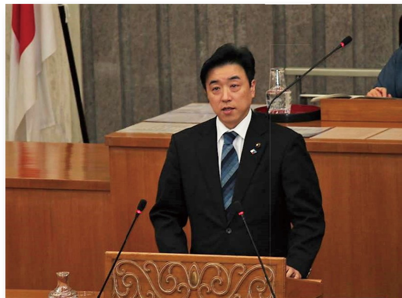
▲2月定例会一般質問—2018年3月2日

昨年12月、福祉公安委員会の所属となり副委員長を拝命いたしました。 また、12月定例会にて設置された特別委員会では、交流人口拡大・過疎地域等振興対策特別委員会の所属となり、こちらも同じく副委員長となりました。いずれも県政の最重要課題である少子高齢化や人口減少対策に深く関わる委員会ですので、しっかりと議論を重ね福島県の復興と会津地域の発展に尽くして参ります。